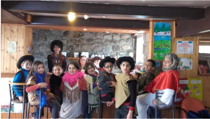
Les cowboys et les indiens au saloon