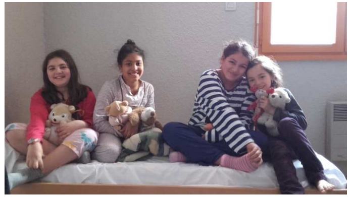
Dernières scènes à filmer ce matin sous le soleil.